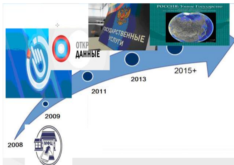
Слайд № ___ - Вектор развития электронного правительства России 2008-2015 гг.