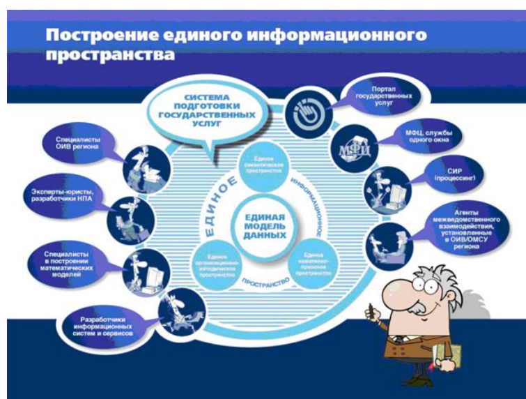
Слайд №___ Единое информационное пространство межведомственного взаимодействия при предоставлении электронных услуг